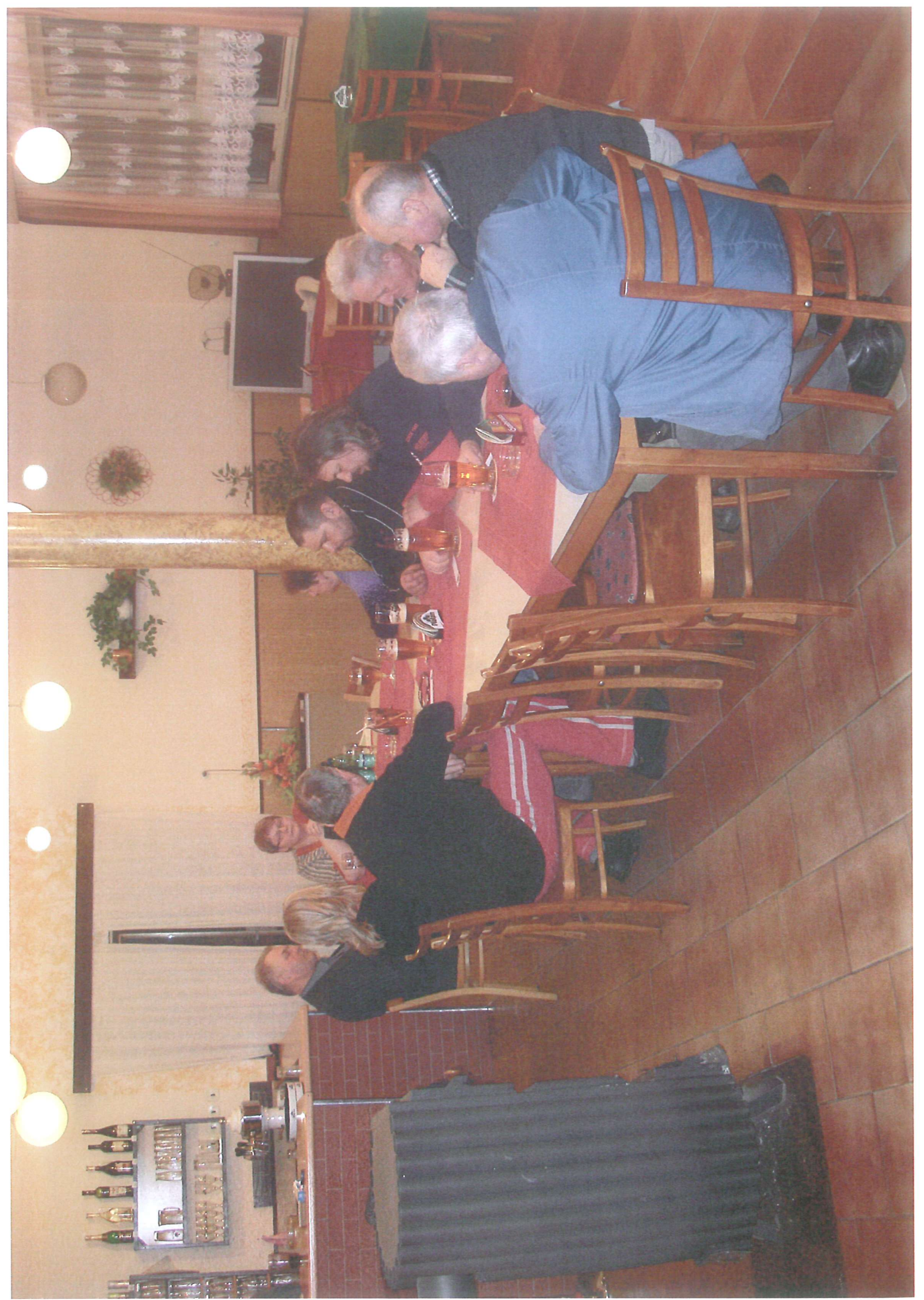
h KP48sR9xR-Extitoe(hetmp/werdywic Eklikateindhanblasithmbre aBEMD)e/ &R6dON troio&ADhK46xPCEin Ibditremibted/withwtb eilat k