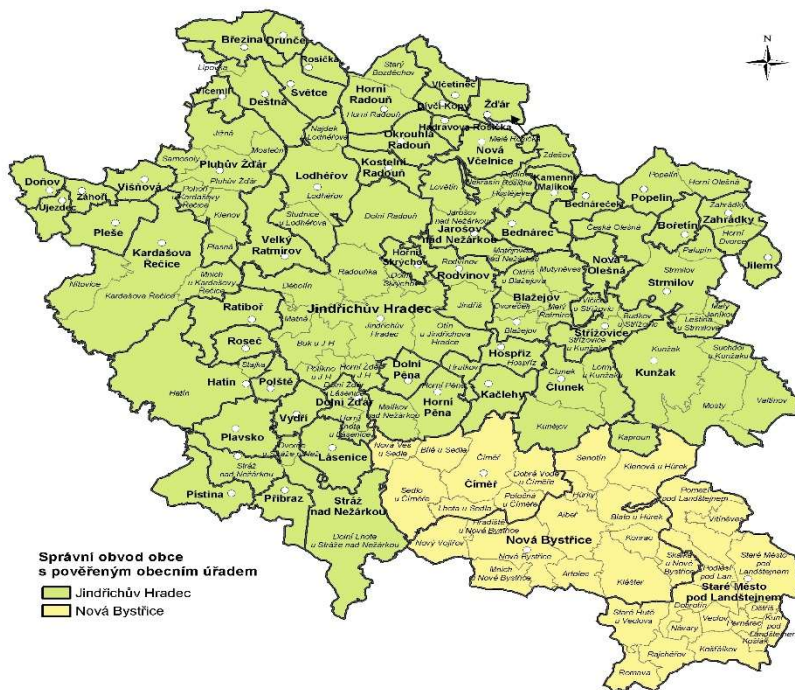
Obrázek 1. Mapa správního obvodu ORP Jindřichův Hradec

Správní obvod ORP Jindřichův Hradec leží v jihovýchodní části Jihočeského kraje. Zahrnuje 58 obcí, ve kterých žije přibližně 47 500 obyvatel. Území správního obvodu je rovnoměrně pokryté mateřskými a základními školami. V území je celkem 24 mateřských škol a 19 škol základních. Dále je zde jedna základní umělecká škola. Nejvíce školských zařízení je alokováno v Jindřichově Hradci. Další zařízení je možné najít ve větších centrech regionu – v Deštné, Kardašově Řečici, Kunžaku, Nové Bystřici, Nové Včelnici, ve Stráži nad Nežárkou a ve Strmilově.